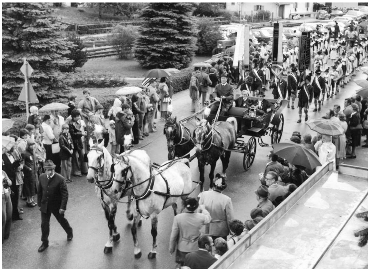
Festzug vor dem Gasthof Prinzregent anno 1976

Zuletzt wurde das Gaufest vor 30 Jahren, also 1996, bei uns in Marquartstein begangen. Viele aus der mittleren und älteren Generation erinnern sich noch heute gerne an diese einzigartigen Festtage. Auch 1976, 1951 und 1926 kam man in Marquartstein zu Gaufesten zusammen: