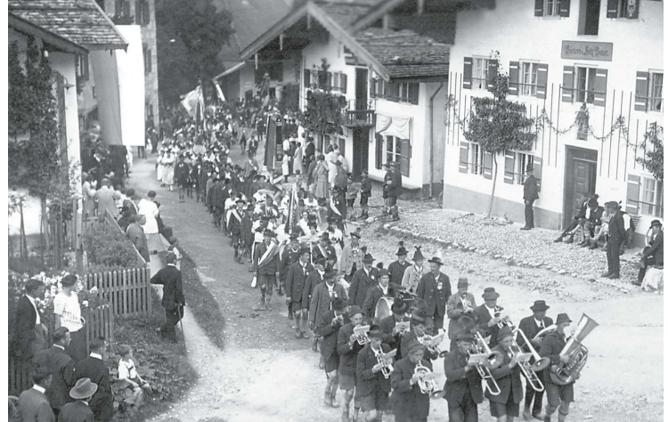
Beim Gründungsfest 1926 ging es durch die Alte Dorfstraße

Das diesjährige Gaufest des Chiemgau Alpenverbandes ist in jeder Hinsicht nicht nur eines von vielen: Der Verband wurde am 25. Juli 1926 hier in Marquartstein im Hofwirth zur Post gegründet. Wir feiern also das 100. Jubiläum an dem Ort, an dem die Wiege dieser großen Trachtenbewegung stand – bei uns im Dorf. Gleichzeitig begehen wir den 100. Geburtstag des Trachtenvereins Piesenhäusen , der bis zum Zusammenschluss mit dem Trachtenverein Marquartstein im Jahr 1968 ein eigenständiger Verein war.