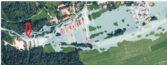
Bild: HQextrem; roter Pfeil deutet auf Standort des Rückhaltebeckens (Wasserwirtschaftsamt Traunstein)

Der Freistaat Bayern, vertreten durch das Wasserwirtschaftsamt Traunstein, plant den Bau eines Geschiebe- und Wildholz-Rückhaltebeckens am Tennbodenbach (Gewässer III. Ordnung, Wildbach) oberhalb von Niedernfels/Piesenhausen. Ziel ist es, diese Ortsteile vor den Folgen von Hochwasserereignissen mit hohem Feststofftransport (einschl. Murenabgängen) zu schützen, die erhebliche Schäden an Gebäuden und Infrastruktur (Schule, Hochplattenbahn, Hochwasserbehälter) verursachen könnten.